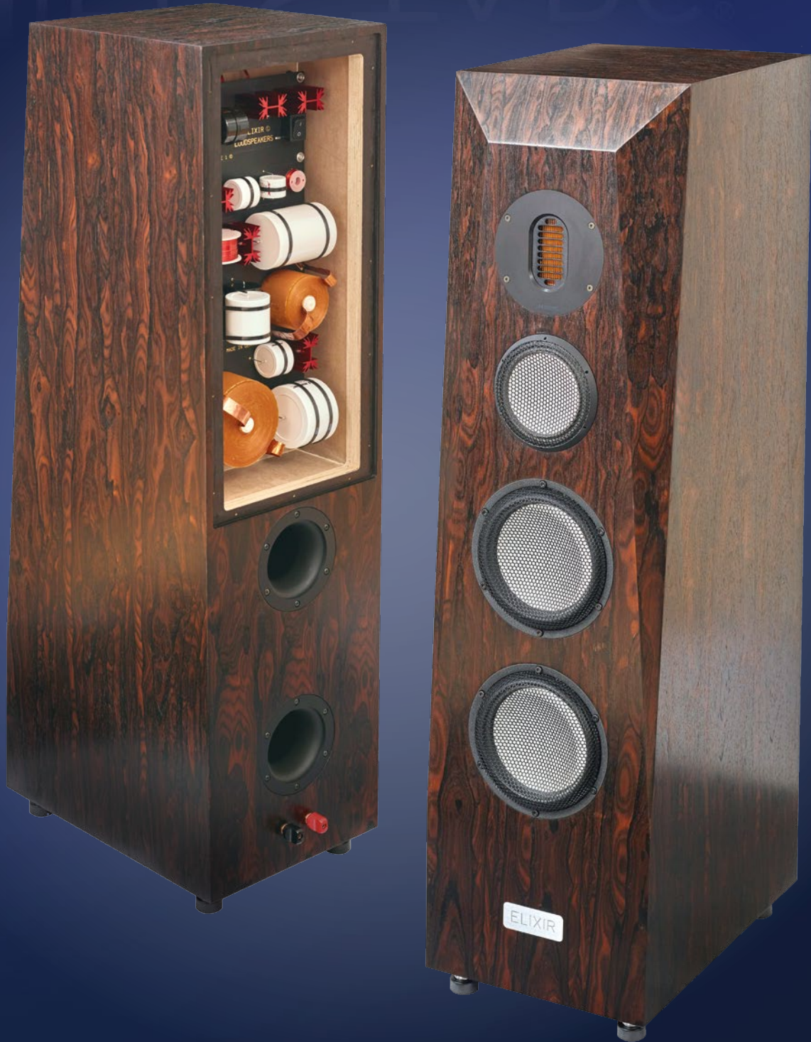
Elixir Greenline 1 | Steve Waitt | Aston Martin DB11 Volante

Deutschland € 11 | Österreich € 12,30 | Luxemburg € 13,00 | Schweiz sfr 15,50